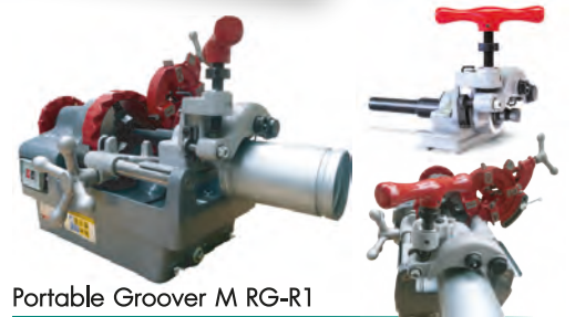
Portable Groover M RG-R1